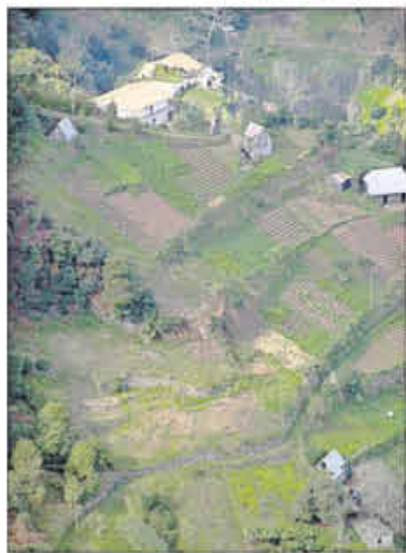
Bauernhöfchen mit Terrassenfelderwirtschaft auf der portugiesischen Insel Madeira.