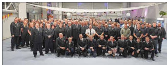
Gruppenbild der anwesenden Kameradinnen und Kameraden

Wir bedanken uns herzlich bei allen Helferinnen und Helfern sowie bei allen Teilnehmenden. Wir freuen uns auf das nächste Jahr!