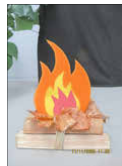
Lagerfeuer von Kindern der Kita „Peeneflöhe“

Die Freiwilligen Feuerwehren des Amts Züssow feierten am Samstagabend den 15.11.2025 die engagierte Arbeit ihrer Kameradinnen und Kameraden. Beim Amtsfeuerwehrball in der geschmückten Gästehalle des Caravan & Resort Gützkow setzten rund 200 Gäste aus allen Wehren sowie Partnerinnen, Partner, Unterstützerin und Unterstützern ein Zeichen für Gemeinschaft, Tradition und Ehrenamt.