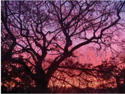
Sonnenuntergang im Pfarrgarten

Zum Krippenspiel der Nicoläuse am 4. Advent (14.12.25) laden wir Sie ab 16.00 Uhr herzlich nach Gützkow ein.