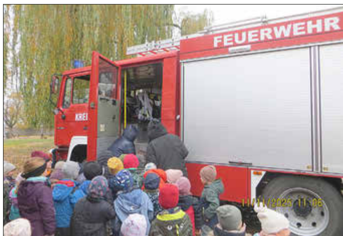
Erkundung des Feuerwehrautos durch die Kinder

Ihr Fachbereich Bürgerdienste in Zusammenarbeit mit der Amtswehrführung