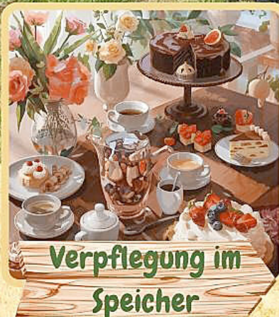
Verpflegung im Speicher