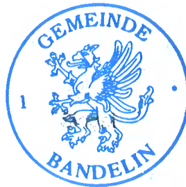
D. Brassow Bürgermeister

Datum der öffentlichen Bekanntmachung gemäß Hauptsatzung im Internet auf www.amt-zuessow.de unter Bekanntmachungen/ Öffentliche Bekanntmachungen (Amt, Gemeinden) am 11.02.2026