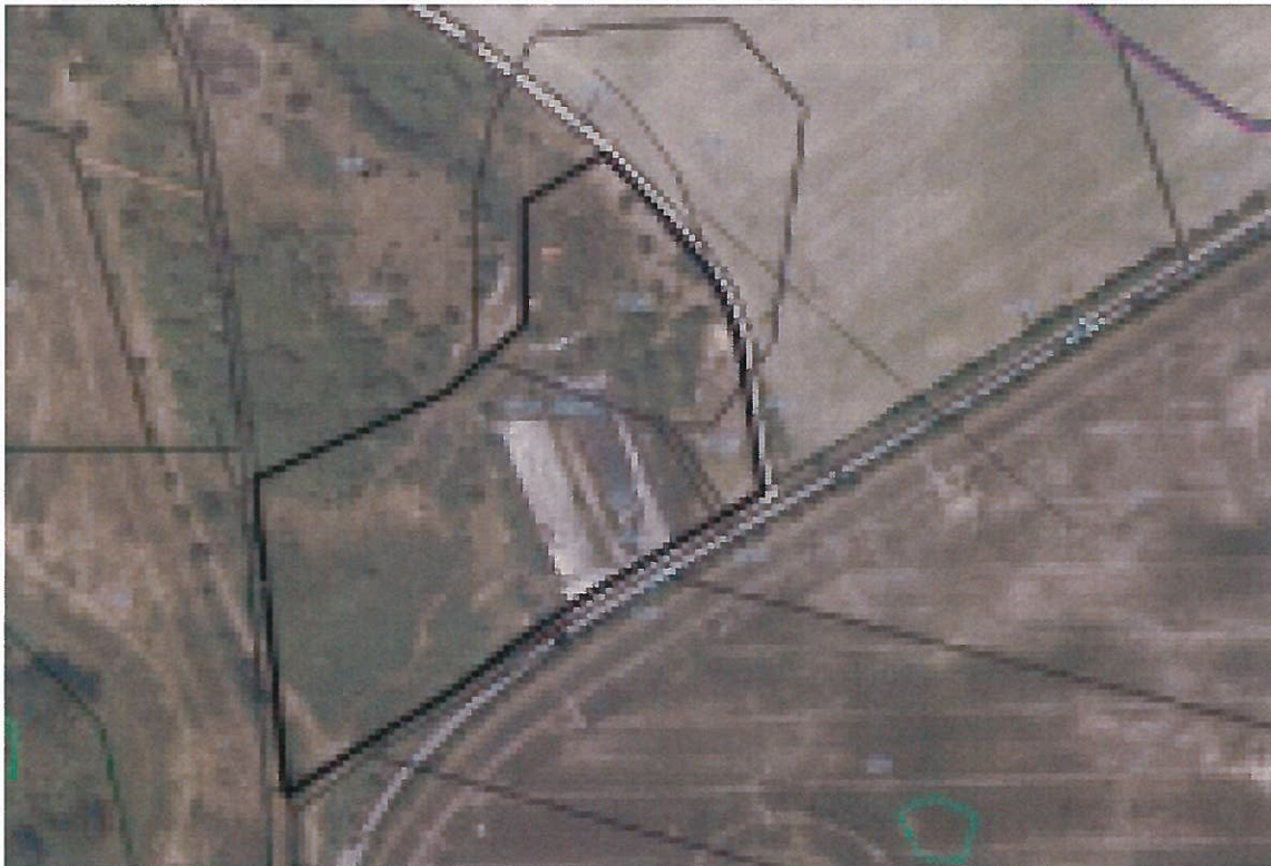
Abbildung 1: Luftbild, schwarzes Polygon ist Fläche der Änderung

Es werden folgende Planungsziele verfolgt: Errichtung einer Freiflächen-Photovoltaikanlage.