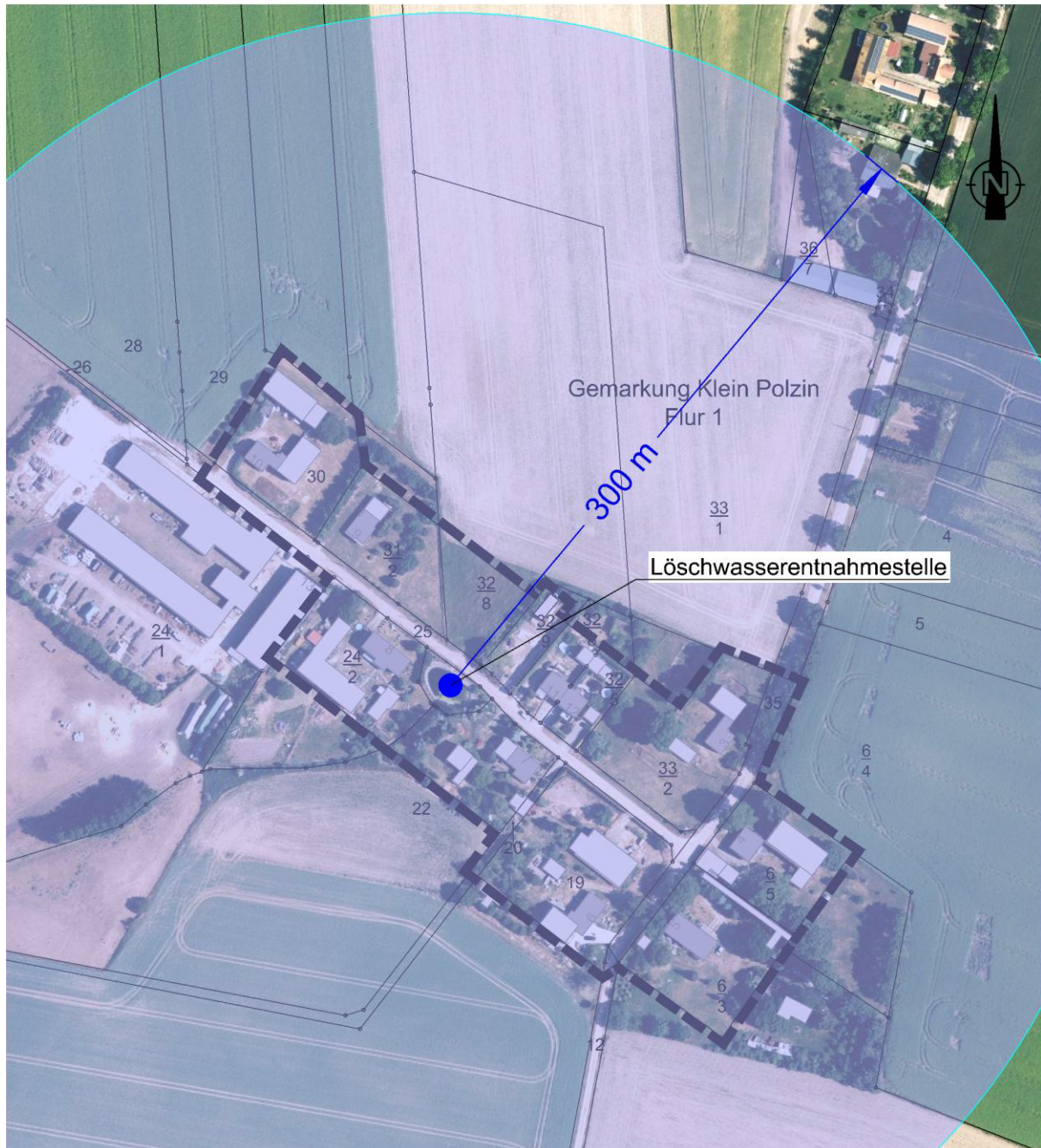
Abb. 01: Löschwasserentnahmestelle (Löschteich) auf dem Flurstück 23, Flur 1 der Gemarkung Klein Polzin mit 300m-Radius

Die Löschwasserversorgung ist demnach abgesichert.