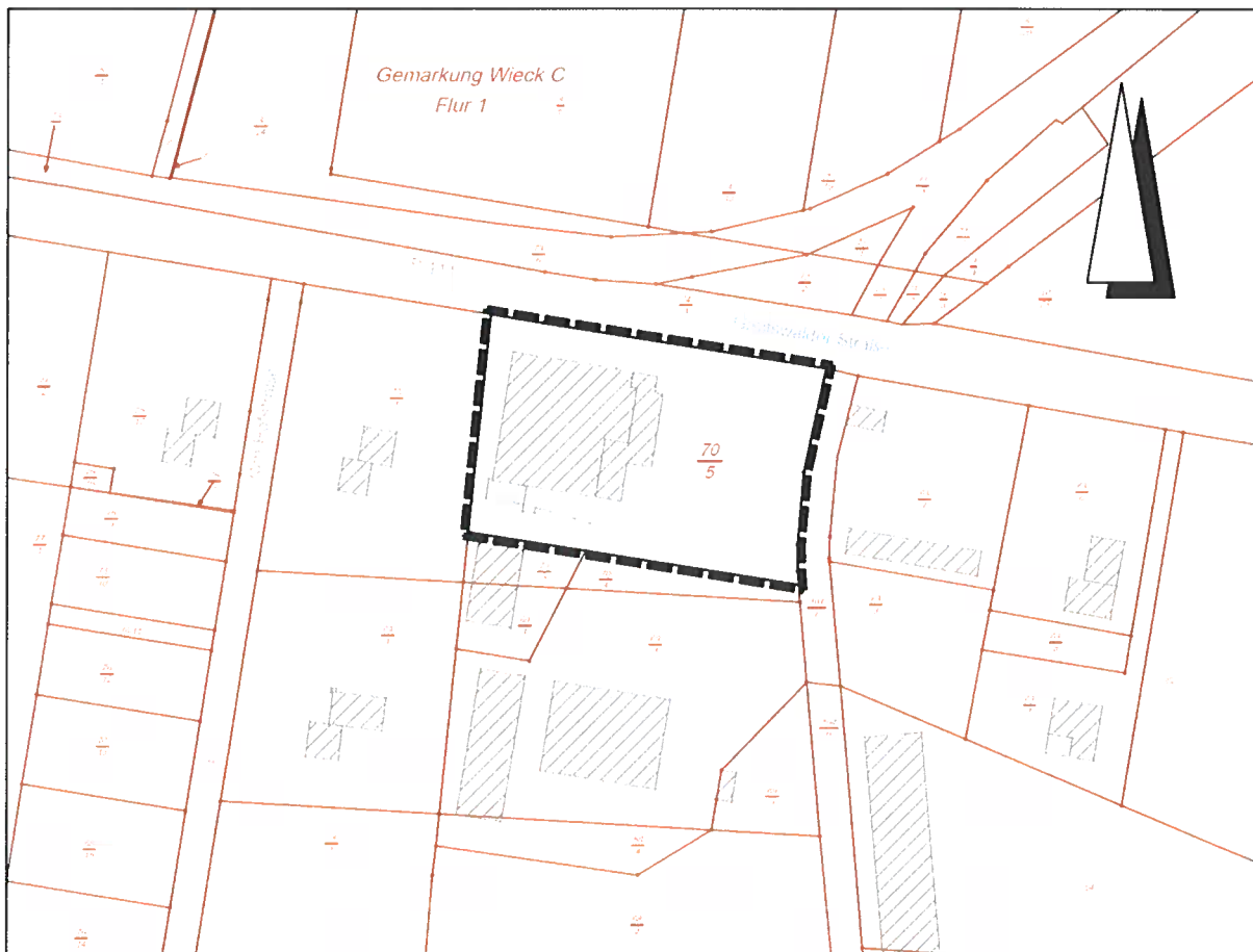
Geltungsbereich des Bebauungsplanes Nr. 16 „Netto-Markt an der Greifswalder Straße“ der Stadt Gützkow (schwarz umrandet)

Der Geltungsbereich des Bebauungsplanes Nr. 16 „Netto-Markt an der Greifswalder Straße“ der Stadt Gützkow befindet sich südlich an der Greifswalder Straße in 17506 Gützkow, hat eine Flächengröße von rund 0,5 ha und umfasst folgendes Grundstück: Flurstück 70/5 der Flur 1, Gemarkung Wieck C.