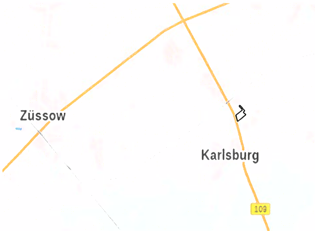
Abbildung 1: Übersichtslageplan mit Darstellung des räumlichen Geltungsbereichs der vorhabenbezogenen Bebauungsplans Nr. 4 „Energiewandlungsanlage Karlsburg“, Stand: 22.05.2023

Die gemäß § 3 Abs. 1 BauGB erforderliche frühzeitige Unterrichtung der Öffentlichkeit sowie die frühzeitige Beteiligung der Behörden und sonstigen Träger öffentlicher Belange gemäß § 4 Abs. 1 BauGB und der Nachbargemeinden gemäß § 2 Abs. 2 BauGB, soll nach den gesetzlichen Vorgaben durchgeführt werden.