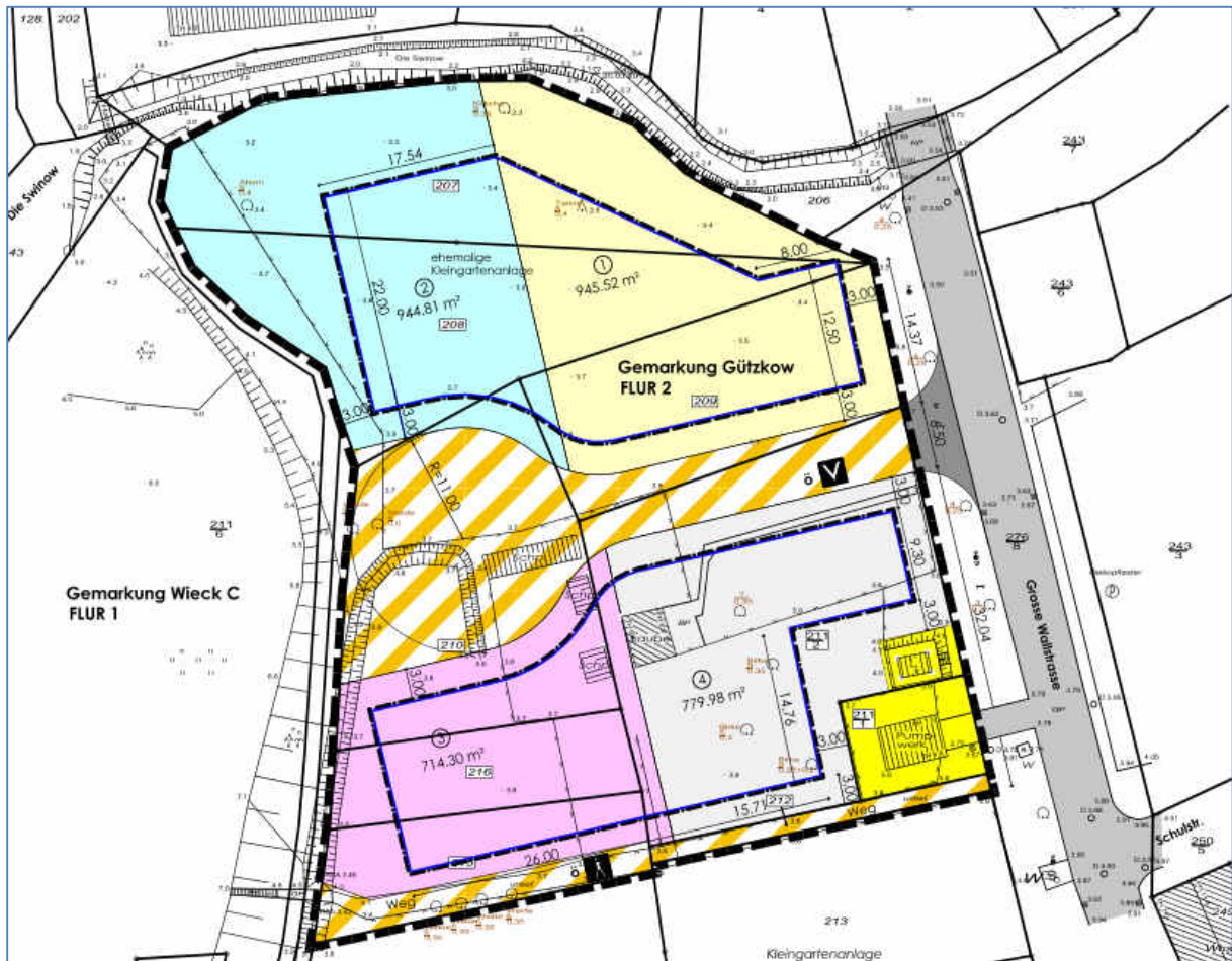
Abb. 2 Planzeichnung

grundlage. Ziel ist es, die aus artenschutzrechtlicher Sicht relevanten Konfliktpotenziale zusammenzufassen und diesen mögliche Vermeidungsmaßnahmen bzw. vorgezogene Ausgleichsmaßnahmen (sog. CEF-Maßnahmen) gegenüberzustellen. Auf diese Weise soll die Notwendigkeit der Zulassung von Ausnahmen von den Verbotstatbeständen des § 44 BNatSchG seitens der zuständigen Naturschutzbehörde bzw. der Beantragung einer Befreiung gemäß § 67 BNatSchG ermittelt werden.