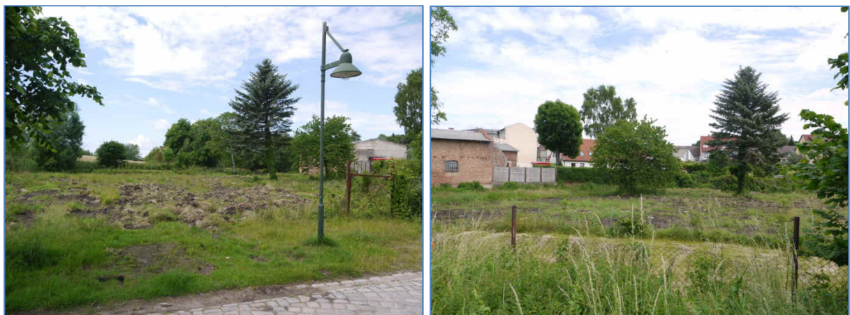
Abb. 3 und 4 Ansichten des Plan- und Untersuchungsgebietes