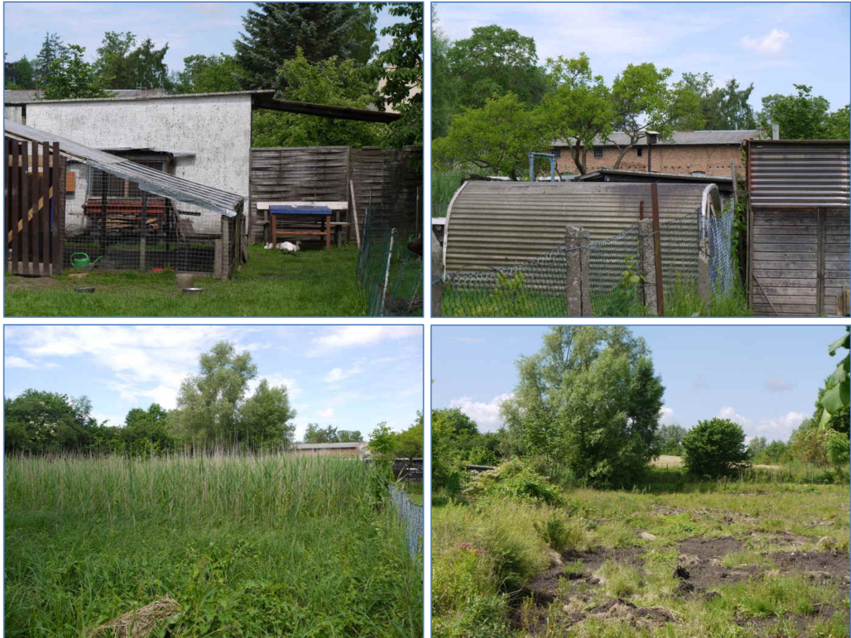
Abb. 5 bis 8 Weitere Ansichten des Plan- und Untersuchungsgebietes